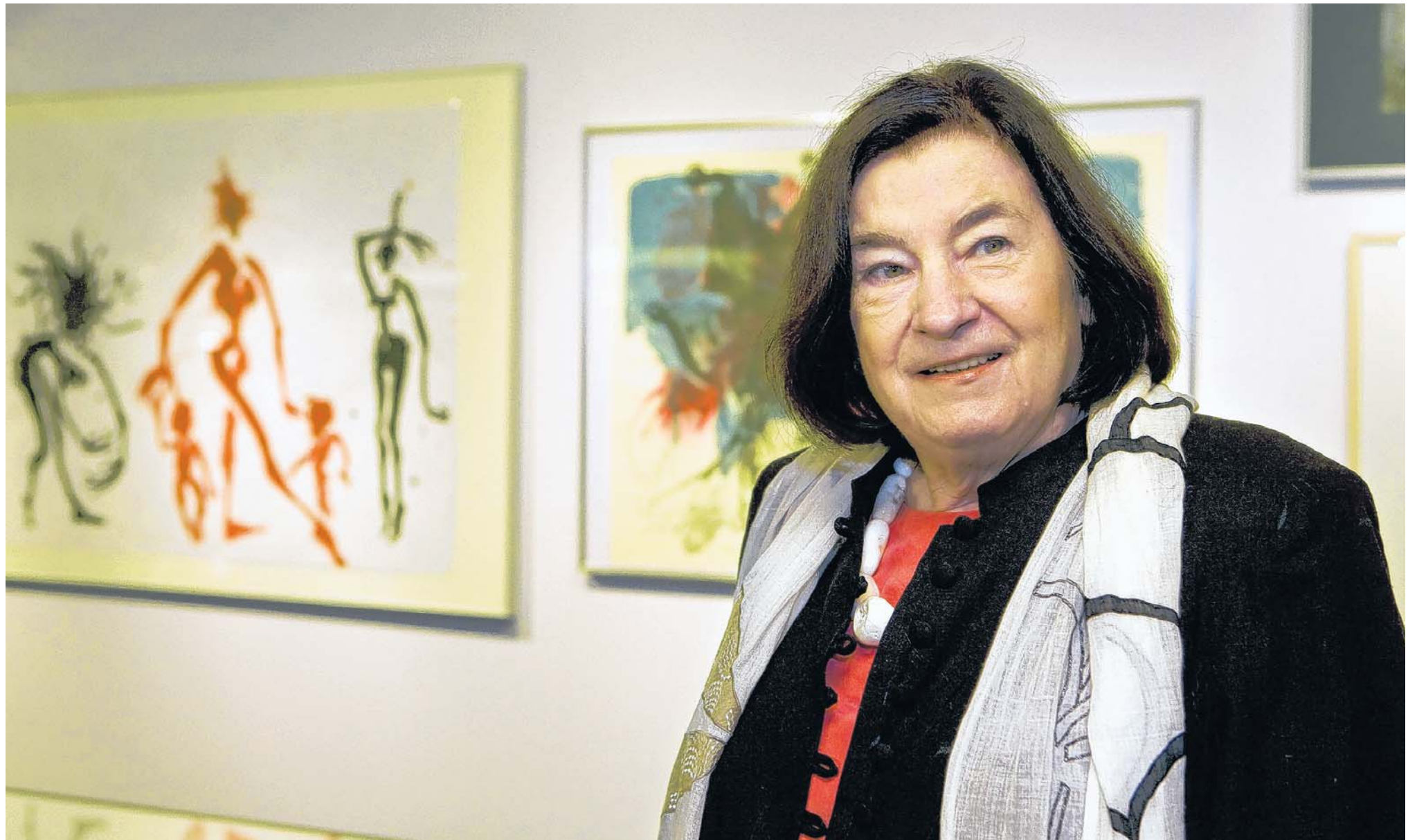
Christa Wolf in der Berliner Akademie der Künste, die ihr zum 80. Geburtstag im vergangenen Jahr eine Ausstellung mit Werken vieler befreundeter Künstler widmete.

Ja. Das Erinnern, das Nach-Denken ist sehr entscheidend. An man-